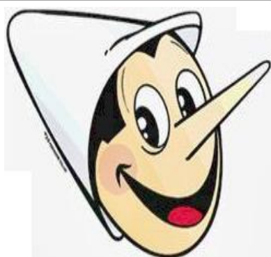
Scuola dell'Infanzia COLLODI